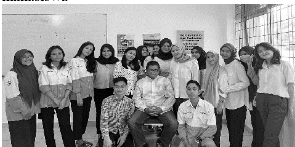
Foto bersama para Panitia dan akitifis organisasi kampus