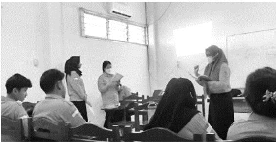
Suasana kehadiran anggota dan Pengurus organisasi dari beberapa kampus