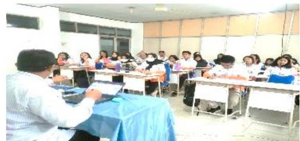
Antusias peserta ceramah Kepemimpinan dan Pembuatan Website