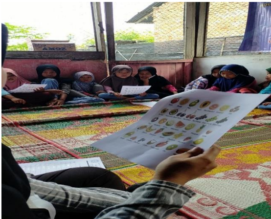
2. Suasana Pelatihan