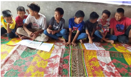
3. Foto bersama penyaji dan peserta pelatihan