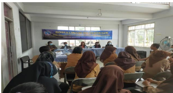
Gambar 2. Susasana peserta saat mendengarkan Paparan narasumber