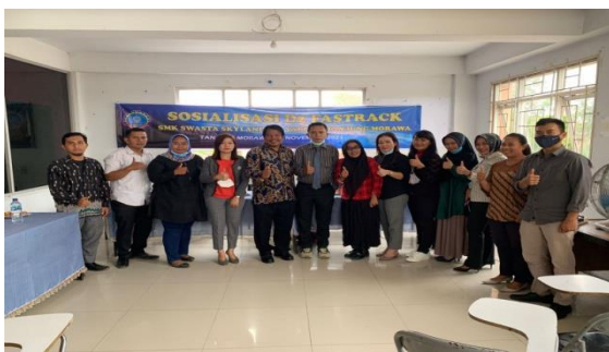
Gambar 3. Dokumentasi Narasumber dengan Panitia Pelaksana