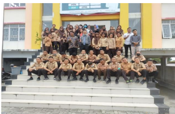
Gambar 4. Dokumentasi Narasumber dengan Peserta Kegiatan