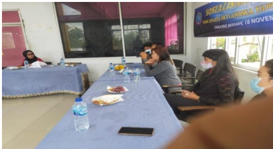
Gambar 1. Pelaksana Pengabdian memberikan Paparan kepada para peserta