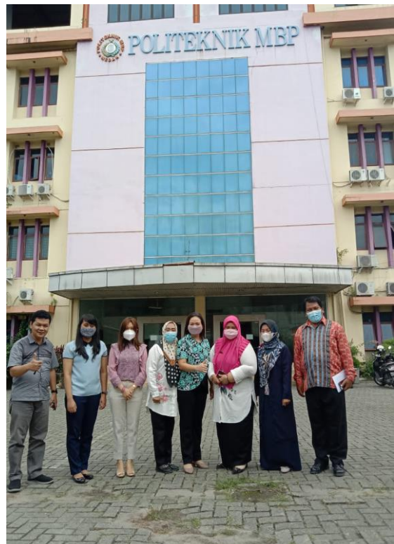
Gambar 5. Dokumentasi Para Narasumber Penyelarasan Kurikulum D2 Jalur Cepat Layanan Hotel Terapung di Kampus Politeknik MBP