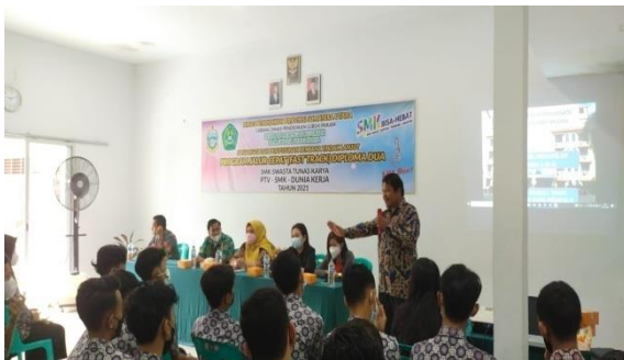
Gambar 1. Pelaksana Pengabdian memberikan Paparan D2 Jalur Cepat Layanan Hotel Terapung kepada para peserta di SMK Tunas Karya