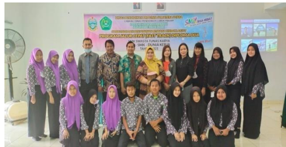
Gambar 4. Dokumentasi Narasumber dengan Peserta Sosialisasi D2 Jalur Cepat Layanan Hotel Terapung