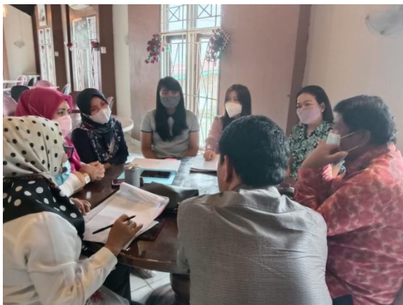
Gambar 6. Para Narasumber melakukan diskusi Penyelarasan Kurikulum D2 Jalur Cepat Layanan Hotel Terapung di Kampus Politeknik MBP