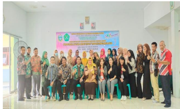
Gambar 3. Dokumentasi Narasumber dengan Panitia Pelaksana

Dokumentasi kegiatan Sosialisasi Program D2 Jalur Cepat Layanan Hotel Terapung di SMK Tunas Karya Batang Kuis seperti pada gambar dibawah ini: